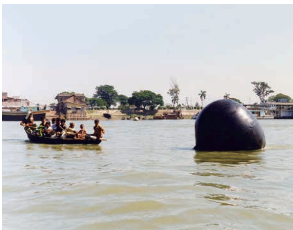
風倉匠 パフォーマンス 《カバラ95 ブリガンガ》1995年 第7回バングラデシュ・アジア美術ビエンナーレ