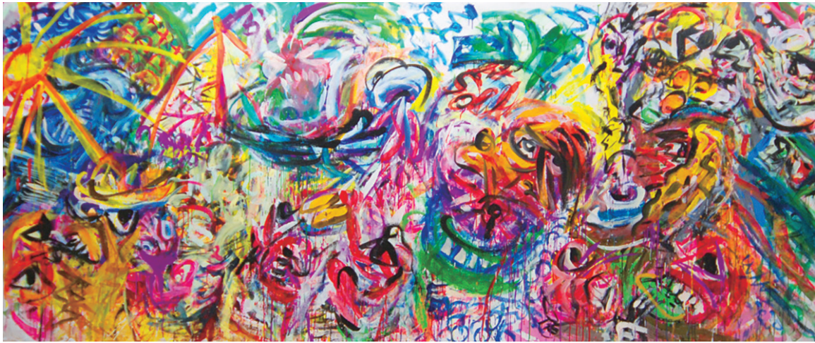
篠原有司男 《パリだぜ！牛ちゃんー親友、木下新に捧げる》 2020年 アクリル、キャンバス 183×435cm