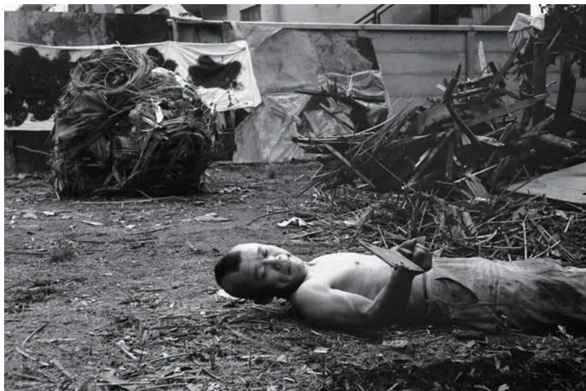
篠原有司男 (1960年)