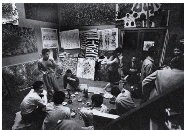
新宿ホワイトハウス (撮影:石黒健治 1960年)