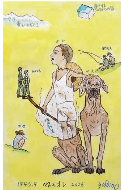
吉野辰海 《1945.9 ベスとオレ》2026年 水彩、紙 30×19cm