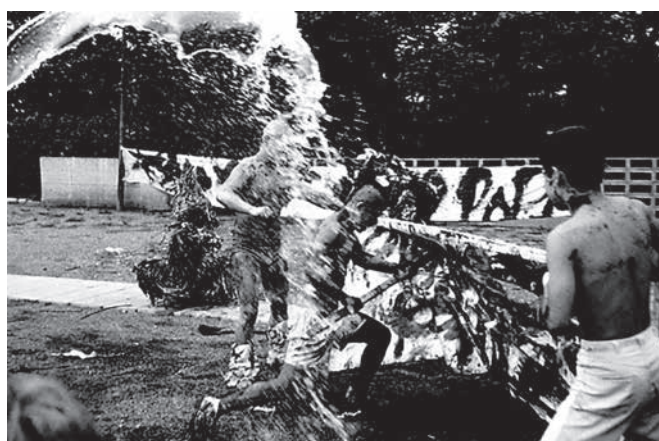
「第3回ネオ・ダダ展」日比谷公園でのパフォーマンス 左から吉村益信、篠原有司男、吉野辰海 (1960年)