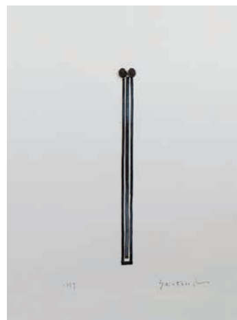
田中信太郎 《余白の形而情一祈り》2017年 鉛、紙 38.5×26.5cm