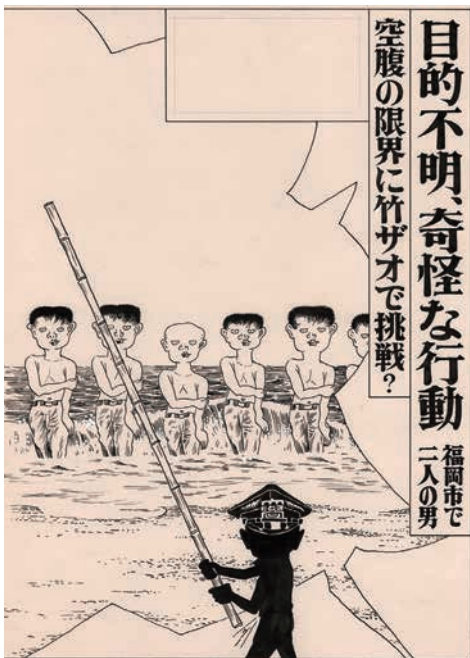
赤瀬川原平 「虚虚実実実話桜画報」挿画原画 1973年 ペン、紙 27.3×19.6cm 『終末から』1973年10月 第3号掲載